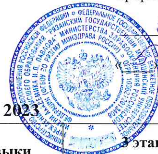
ГРАФИК ПЕРВИЧНОЙ АККРЕДИТАЦИИ – осень 2023